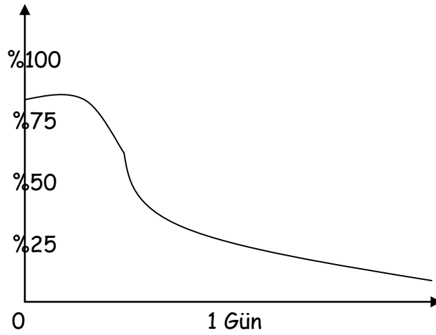
İnsanın hatırlama eğrisi

Genellikle 45-50 dakikalık bir süre ara vermeden çalışmak için uygun olan süredir. Bundan daha kısa bir süre çalışmanın verimi için yetersiz gelir. Daha uzun bir süre ise konun daha çabuk unutulmasına neden olur. İlk 45-50 dakikadan sonra 10 -15 dakika ara verilip yeniden öğrenmeye devam edilirse hatırlama eğrisi daha yükseğe çıkar ve öğrenme kapasitesi daha etkin kullanılmış olur. Çalışılan 45-50 dakika süresince beyne giden bilgiler, verilen 10-15 dakikalık aralıklarla gerekli yerlere yerleştirilecek ve beyindeki mevcut bilgilerle ilişki kurulacak, böylece bilgiler özümsecektir. Bu dinlenme aralığı, beynin kendi kendine çalışması için boş bırakılmalıdır. Yani zihinsel bir etkinlik yapılmamalıdır. Bu süre kısa bir yürüyüş, hafif fiziki aktiviteler, müzik dinleme, gevşeme egzersizleri gibi enerjiyi yenileyen uygulamalar ile değerlendirilebilir.